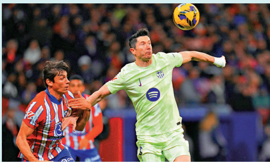
▲巴塞隆拿前鋒羅拔利雲度夫斯基(右)。

【大公報訊】綜合ESPN FC、香港賽馬會足彩報章：西班牙盃4強次回合明天凌晨3時30分上演，由馬德里體育會回到主場再鬥巴塞隆拿。雙方首回合踢得燦爛，最終竟以4:4打成平手，不過馬體會近來表現反覆，反觀巴塞最近氣勢甚盛，連戰連勝，讓球巴塞讓平/半，投注上盤支持巴塞贏波晉級為妙。