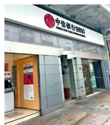
▲中信銀行（國際）推新優惠吸客。

額外利率會加在相應幣種的現有一般儲蓄利率上。於推廣期內，額外利息將與一般儲蓄利息同於每個月最後一個銀行營業日存入登記戶口。客戶的登記戶口必須在登記期內至少一個銀行營業日滿足相應幣種的最低合資格存款金額要求，才能享有適用的額外利率。