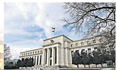
▲聯儲局主席鮑威爾有信心通脹將會回落，年內將繼續減息，這有利金價表現。

道富相信，金價在未來6至9個月將會繼續向上破位，在升破3100美元後，便有潛力挑戰3300至3400美元，但升勢亦並非一氣呵成，投資者將會面對一段時期的整固，回調幅度將介乎5至7%之間，這亦經常出現於金價每個上升的周期中。