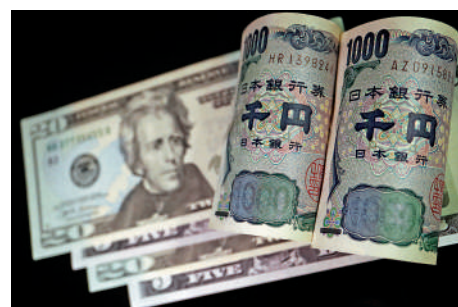
▲美國經濟衰退的可能性增加，日圓將為投資者提供最佳的貨幣對沖工具。

【大公報訊】高盛集團預計，由於對美國經濟增長和貿易關稅的不安情緒提振了對最安全資產的需求，日圓兌美元匯率今年將攀升至140區間的底部。高盛全球外匯、利率和新興市場策略主管Kamakshya Trivedi表示，如果美國經濟衰退的可能性增加，日圓將為投資者提供最佳的貨幣對沖工具。