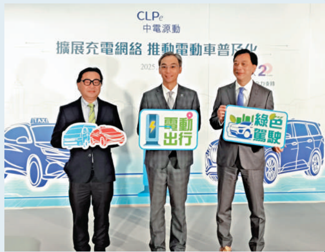
▲中電源動與領展合作，計劃在今年內將充電位增加至250個，網絡擴至20個停車場。