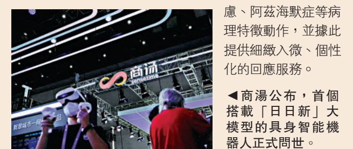
▲商湯公布，首個搭載「日日新」大模型的具身智能機器人正式問世。

在實際應用中，「SenseNova-50」讓機器人能精準捕捉患者微妙的表情變化和情緒波動，有效判斷例如焦慮、阿茲海默症等病理特徵動作，並據此提供細入微、個性化的回應服務。