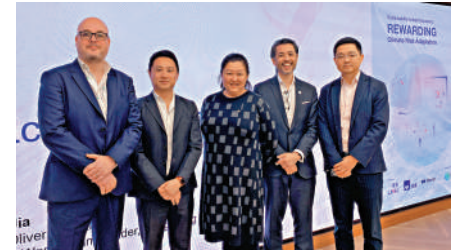
▲AXA安盛、達信及領展昨日發表《可持續發展相連保險：鼓勵應對氣候風險》白皮書。

及透過保險經紀商磋商更佳的條款。至於保險公司方面，應與房地產客戶緊密溝通，以獲取有關氣候應變措施的詳細資料；將提升抗逆力的項目正式納入核保流程，並提供獎勵；優化核保方法，以應對不斷變化的天氣及氣候模式；以及創新產品設計，優化保障範圍、條款及保費，從而更有效管控氣候相關風險。