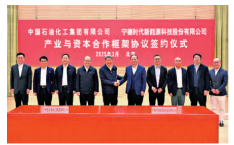
▲寧德時代與中國石化在今年將建造不少於500座換電站。

電業務合作協議》。在推動「萬站計劃」過程中，雙方將共同打造「人、車、能源、生活」一體化服務網絡，為「雙碳」目標落地提供標準化、規模化支撐。