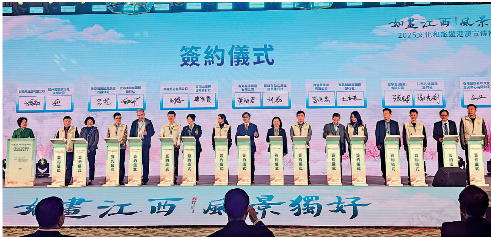
▲嘉賓出席江西省重點旅行社與香港部分門市的合作協議簽約儀式。

江西與香港地緣相近、文脈相通、經濟相融，兩地在文化和旅遊交流方面具備天然優勢。為深化贛港文化旅游合作，促進產業共同發展，江西省文化和旅遊廳聯合亞洲旅遊交流中心於本月舉辦「『Discover Jiangxi』文化和旅遊宣傳推廣活動」。其中，「如畫江西 風景獨好」文化和旅遊（香港）推介會及啟動儀式昨日舉辦，並同步進行江西省重點旅行社與香港部分門市的合作協議簽約儀式。