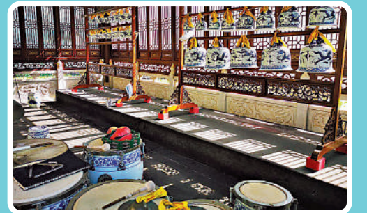
►景德鎮古窯民俗博覽區。

途 經：景德鎮、上饒、鷹潭 主要景點：古窯民俗博覽區、陶陽里歷史文化旅遊區、三清山旅遊景區、望仙谷、篁嶺、龍虎山旅遊景區