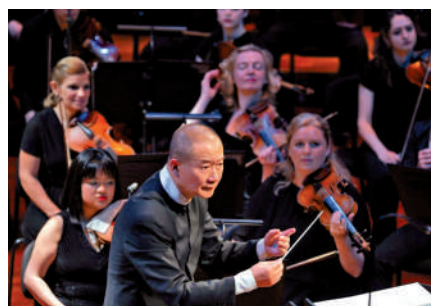
◀譚盾在布達佩斯藝術宮指揮《慈悲頌》。