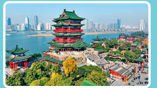
►南昌滕王閣旅遊區。

途 經：南昌、九江、景德鎮 主要景點：滕王閣旅遊區、海昏侯國家考古遺址公園、廬山西海景區、古窯民俗博覽區、景德鎮陶溪川文創街區