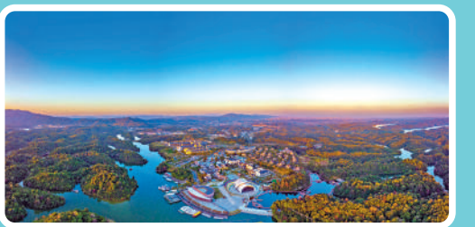
►新余市仙女湖七夕文化旅遊度假區。

途 經：新余、宜春、萍鄉 主要景點：仙女湖七夕文化旅遊度假區、贛西民俗風情街、明月山旅遊區、熊出沒樂園、武功山景區