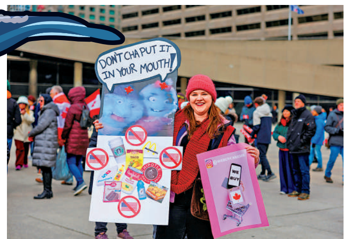
▲ 加拿大民眾3月22日在多倫多參加反美示威。

沙克3月31日質問：「現在，當我們需要盟友時，特朗普認為誰會幫助我們？想想美國政府的所作所為，如果再次發生9·11事件，誰還會同情美國人？」