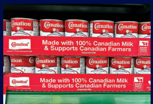
▶ 加拿大商店鼓勵顧客購買國產商品，以示對美國關稅威脅的抗議。