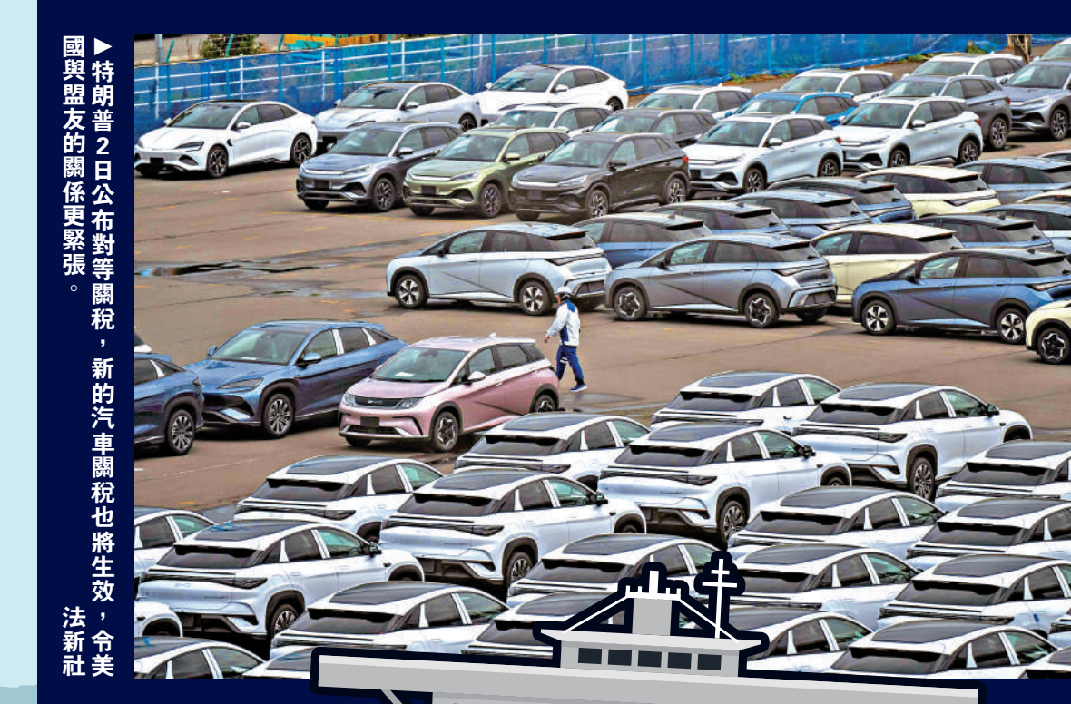
▶ 特朗普2日公布對等關稅，新的汽車關稅也將生效，令美與盟友的關係更緊張。

日本貿易振興機構預測，特朗普政府的對等關稅、汽車關稅等政策將導致全球GDP到2027年減少0.6%，相當於全球經濟蒙受7630億美元（約59514億港元）損失，而受到最嚴重打擊的正是美國自身。與未實施特朗普關稅政策的情況相比，2027年美國GDP