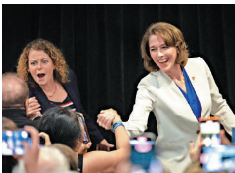
▲ 克勞福德（右）1日贏得威斯康星州最高法院法官補選。

這場選舉受到兩黨高度關注，也成為美國最昂貴的司法選舉，競選開支超過1億美元。馬斯克為席