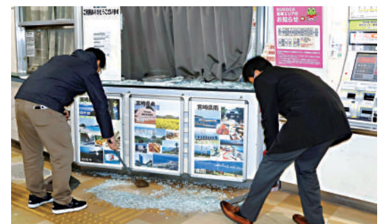
▲ 今年1月，日本宮崎車站的工作人員清理地震震碎的玻璃。

預測報告指出，若南海海槽發生強震，導致超過3米高的海嘯襲擊福島至沖繩一帶，將造成嚴重人員傷亡。在最糟糕情況下，即冬季深夜發生9級地震，將造成29.8萬人喪生，其中21.5萬人死於海嘯。據日媒報導，最新預測報告首次納入在避難期間因身體狀況惡化等死亡的「災害關聯死亡」人數，估計為2.6萬至5.2萬人。