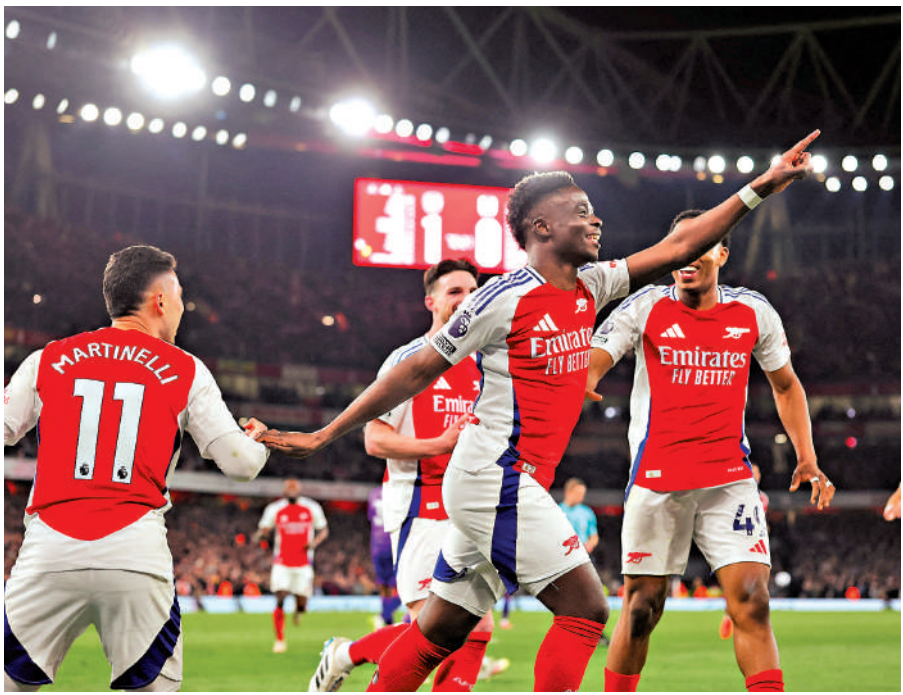
▲沙卡(右二)復出後7分鐘便取得入球,協助阿仙奴擊敗富咸。