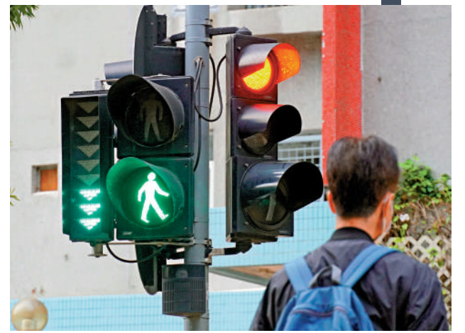
▲旺角街道行人非常多，大部分人都守規則在綠燈人形燈號亮起時才橫過馬路，但部分人在綠燈閃動時仍違規衝出馬路，甚至衝紅燈。