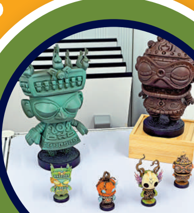
「Wabii樹仔」人偶造型奇特。