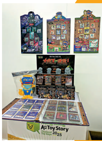
「勇者天使B.O.大魔王」的設計包含搪膠玩具、鏢射貼紙等。