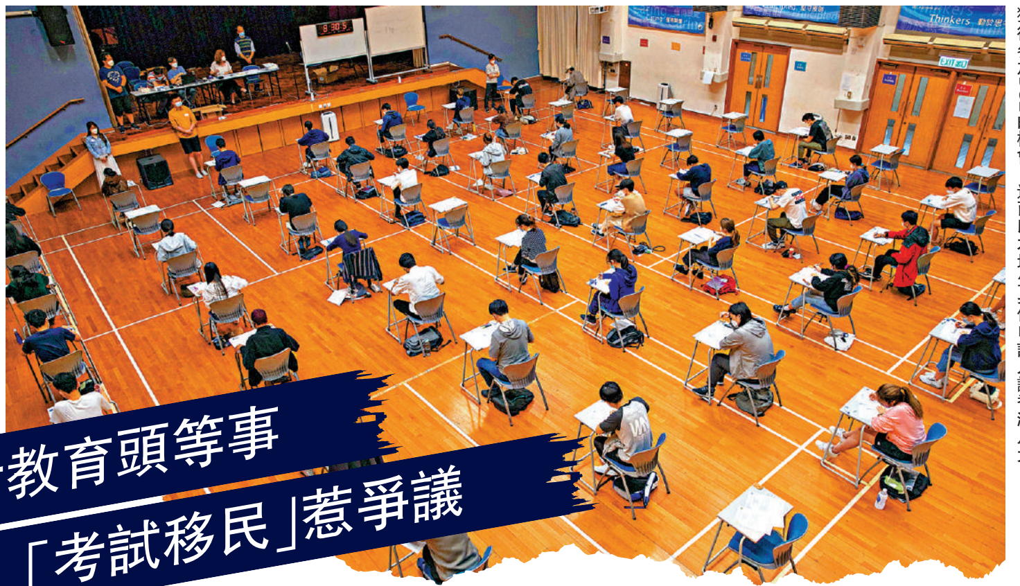
部分沒有意願來港工作的「高才通」申請人，通過合法途徑申請入讀香港八大。