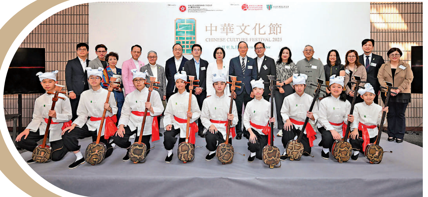
嘉賓出席「中華文化節2025」節目簡介會。