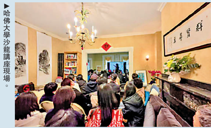
哈佛大學沙龍講座現場。