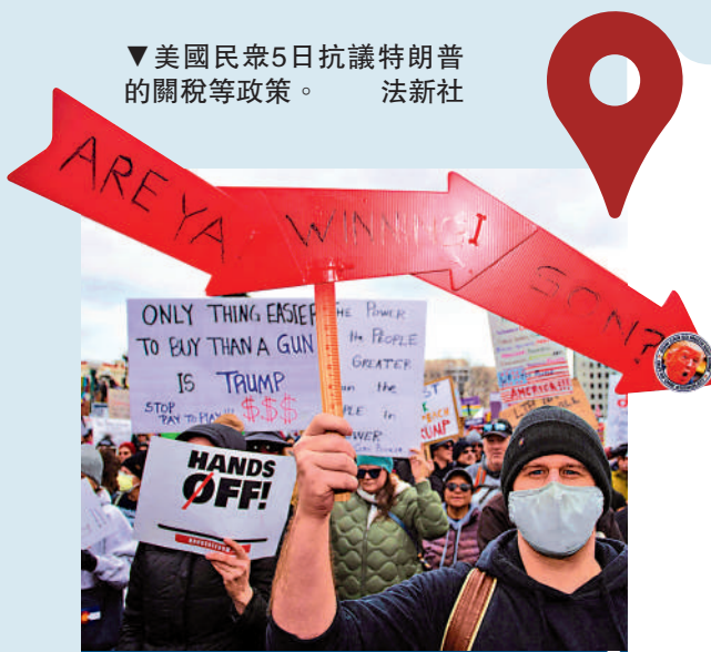
▼美國民眾5日抗議特朗普的關稅等政策。