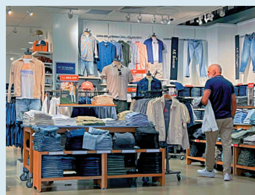
▲歐盟計劃對美國的服裝等商品徵收報復性關稅。

日本首相石破茂7日稱，美國的「對等關稅」政策對日本而言如同「國難」，並表示希望能盡快訪美，與特朗普進行交涉。白宮國家經濟委員會主任哈塞特6日稱，已經有50多個國家和地區與白宮取得聯繫，希望進行貿易談判。