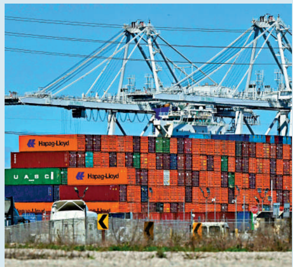
▲特朗普關稅打擊進口，將切斷美國科技供應鏈。