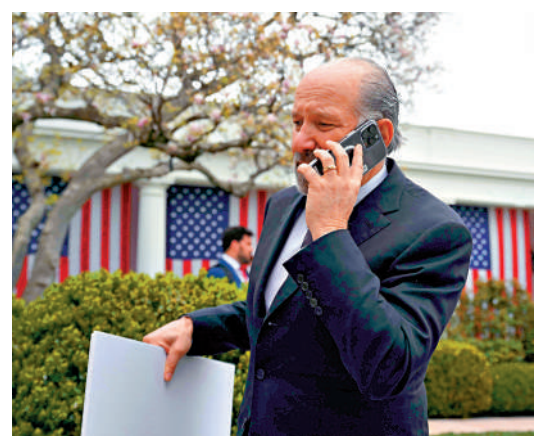
▲盧特尼克稱關稅將促進製造業回流美國，被批不切實際。

工業生態系統。另外，特朗普的「對等關稅」連只有企業棲息的無人島也不放過，引發群嘲。盧特尼克6日辯解稱，這是為了防止其他國家利用這些島嶼「鑽空子」，繞過美國關稅。美國網友並不買賬，指責特朗普政府只想無差別打擊全球供應鏈。