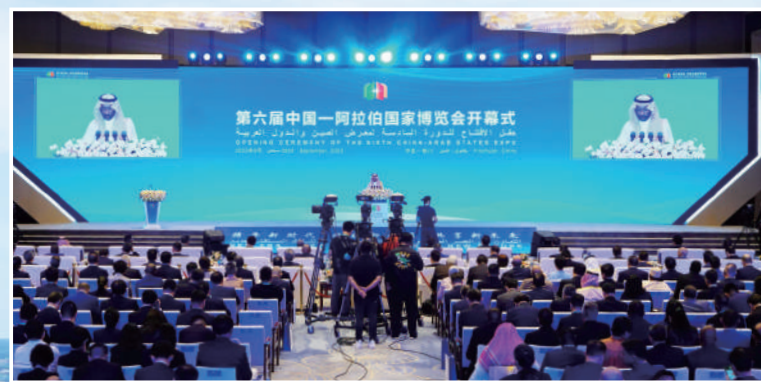
▲第六屆中阿博覽會