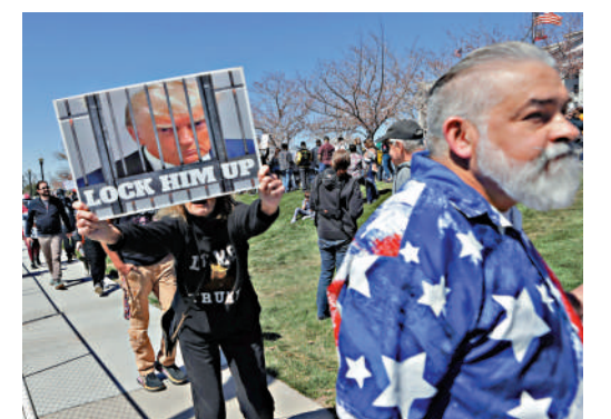
▲美國民眾近日舉行反特朗普示威，抗議人士舉着「把特朗普關起來」的牌子。

專家預測，美國的零售貿易、批發貿易和製造業等行業最有可能面臨裁員，美國的失業率恐上升，負面影響將遠超過關稅政策帶來的收益。CNBC最新一項調查顯示，超過三分之一（37%）的CEO認為今年將裁員。