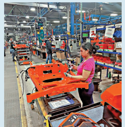
▲工人在美國威斯康星州一家機械工廠安裝零件。

特朗普曾宣稱，關稅將激勵製造業回流美國。但經濟學家和分析師指出，即使是像蘋果這樣有財力將工廠遷回美國的大型企業，也需要數年時間才能在美國建廠，而非所有中小企業都能等那麼久。與此同時，美國人對經濟越來越悲觀，3月的消費者信心指數跌至12年來的最低點。全美獨立企業聯合會（NFIB）8日公布數據顯示，美國中小企業信心指數在3月連續第三個月下降，降至97.4，低於51年平均水平，創2022年6月以來最大跌幅。