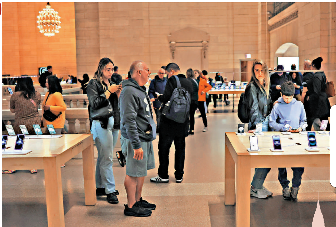
▲顧客在紐約中央車站一家蘋果店內選購商品。