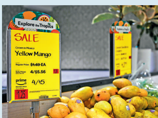
▲紐約一家雜貨店出售從墨西哥進口的芒果。