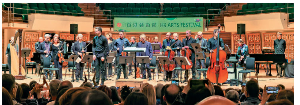
▲音樂會《吱吱喳喳圓舞夜》由維也納現代聲音樂團演出。