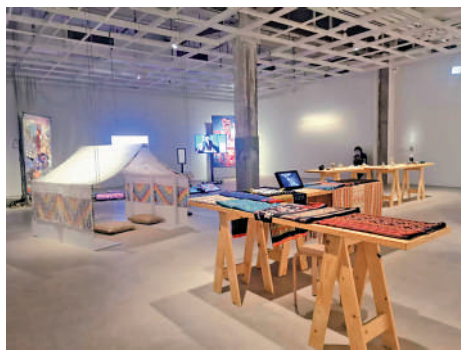
▲「湧動的暗綫——遊走在民間智慧與當代視野之間」展廳一角。

作品，「我希望人們可以藉此思考如何與大自然修復關係，從而關注海洋環保等環保生態議題。」阿里·貝瓦吉表示。人類的活動勢必會對大自然產生一些影響，環保可否訴諸科技？哈薩克斯坦藝術家阿瑪古兒·門利巴耶娃和蘇阿德·加拉創作了三組裝置作品——《河中的夢》、《水之母親：Gulbibi Balkhash》、《裏海9》。