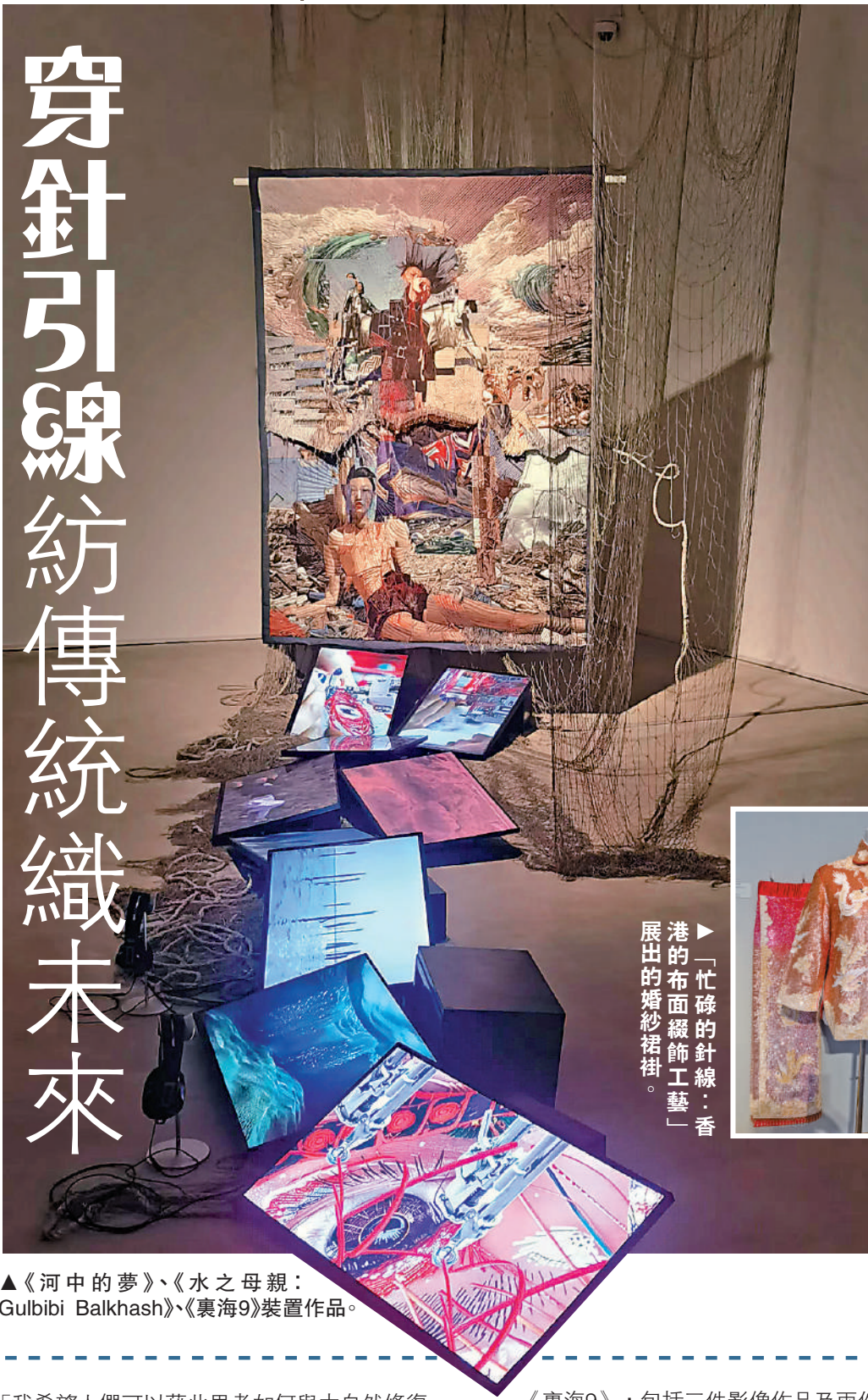
▲「忙碌的針線：香港的布面綴飾工藝」展出的婚紗裙褂。