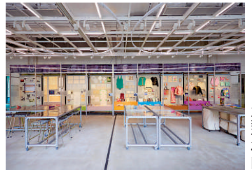
▲「忙碌的針線：香港的布面綴飾工藝」展廳現場。