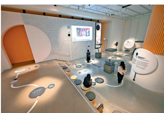
▲「圓夢前行：香港藝術二三事」展覽空間由本地建築設計團隊蕭健偉與陳樹仁，夥拍平面設計師唐承剛設計。

無法長時間站立，但他並未因此放棄，反而轉向使用微軟小畫家創作，《彩龍》便是他在千禧年後的代表作品之一。