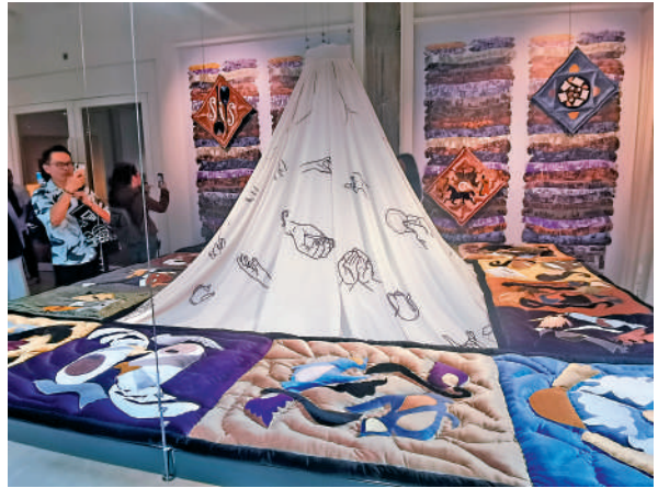
▲艾希莎·沙迪諾娃作品《Dastarkhan她的裙子》。

春日正好，置身CHAT六廠（香港紡織文化藝術館）欣賞展覽，落地窗外的春意，室內是藝術家設計的裝置藝術品，體會傳統紡織如何成為了當代藝術家創作靈感的源泉。「湧動的暗綫——遊走在民間智慧與當代視野之間」呈現多元的民間紡織工藝發展，運用傳統紡織元素，創作具備現代審美視角的裝置藝術，引領觀眾思考人與自然的黏連。