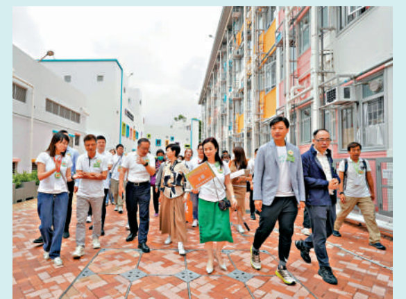
▲何永賢及立法會議員去年出席元朗恒菁新苑過渡性房屋項目的「睇樓導賞團」。

另外，實政圓桌議員田北辰關注交椅洲人工島的進度，認為如果不興建人工島，就沒有香港島經交椅洲接駁到洪水橋的「洪港鐵路」，影響香港融入大灣區。甯漢豪回應說，推展交椅洲人工島是將北都與交椅洲連繫的很好時機，強調政府從未說過放棄交椅洲人工島計劃，只是步速放慢，但包括有關鐵路在內的研究仍在進行；現時經濟環境變化得快，政府會審慎處理，並按情況在預算案中交代。