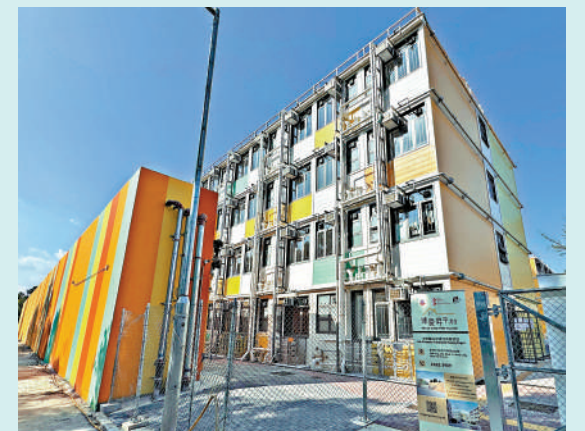
▲房屋局去年為打鼓嶺「博愛昇平村」過渡性房屋項目舉行開放日。

何永賢表示，目前約60%的過渡性房屋輪轉率可達到100%，使用率相當好，而入住率較低的項目位於新界區，去年下半年才落成，相信需時間「熱身」宣傳，早前元朗東頭「同心村」、博愛江夏圍村等項目經「熱身期」後，流轉率都已超過100%。她認為，營運機構可透過舉辦「睇樓團」，親身接觸市民，讓有意入住的市民了解租金和居住環境等情況，提高入住率。