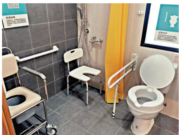
▲報告建議修改公營及資助房屋設計，推動居家安老，減輕長遠醫療開支。

【大公報訊】記者易曉彤報道：香港人口老化日益嚴重，長者醫療開支預算愈來愈大。團結香港基金昨日發表《舊策新計助者健 樂居活齡頤天年》政策報告，就提升香港長者居住環境提出六項建議，包括建議政府將家居改造評估納入長者醫療券獎賞先導計劃，修改公營及資助房屋設計等措施，推動長者居家安老，減輕長遠醫療開支。團結香港基金表示，若能落實有關建議，估計至2046年長者人口比例達36%高峰時，每年入院開支將可減少逾56.7億港元。