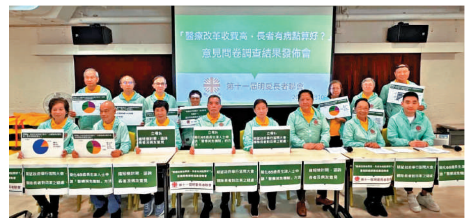
▲明愛長者聯會建議政府舉行答問大會，釋除長者對醫療收費改革的疑慮。

明愛長者聯會建議，政府應舉行答問大會，釋除長者的疑慮，並簡化醫療減免機制申請程序，讓65歲以上、正申請長者生活津貼的市民，毋須提交申請就自動減免費用。他們亦認為，公營醫療收費改革的檢討期，應由兩年縮短至一年，提升改革透明度。