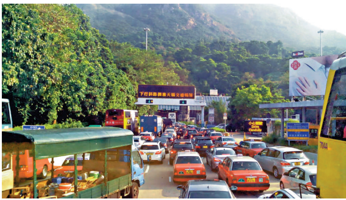
▲香港仔隧道私家車劃一收費五元，已長達34年沒有調整。

出五個的士車隊牌照，需於今年6月底或之前全部投入服務，但至今只有兩支車隊試運，車輛及司機數量不足，不少市民反映叫車有困難。