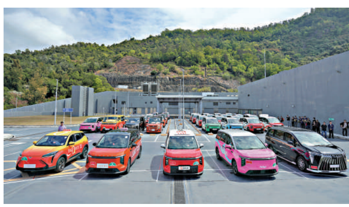
▲目前只有兩支的士車隊試運，車輛及司機數量不足，市民反映叫車有困難。

路段，使用內地創新方法興建，由於北環線支線屬跨境項目，將會採用國家標準及方法興建，縮短興建時間，有信心能與主線同步落成。