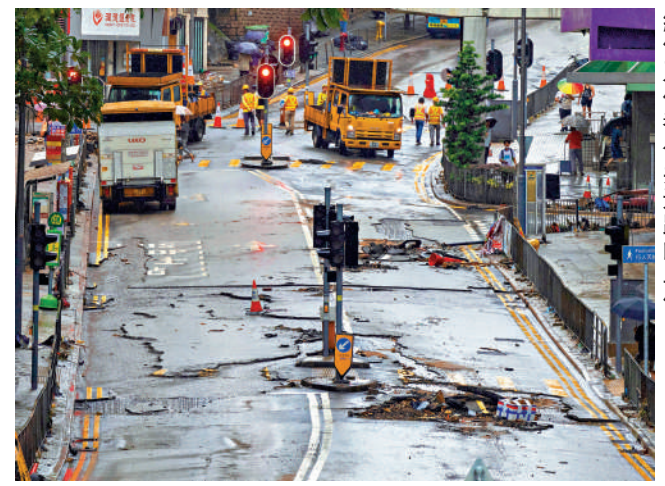
▲申訴專員表示，將主動詳細審研路政署維修及保養公共道路的工作。