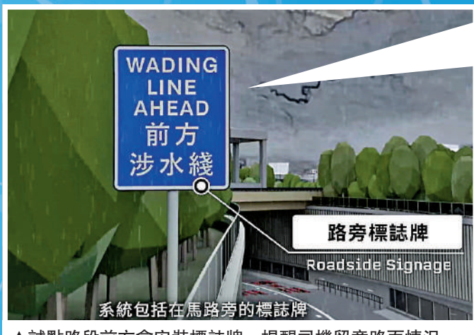
▲試點路段前方會安裝標誌牌，提醒司機留意路面情況。