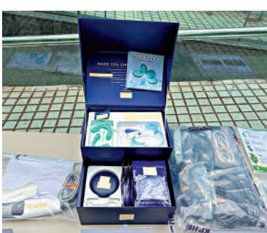
▲警方展示在行動中檢獲的矯形牙套等證物。

尖沙咀警方今年2月接獲一名市民投訴，指在區內某商業大廈一個單位內，接受牙齒矯正服務期間，懷疑提供服務的人是無牌牙醫。警方隨即與衛生署進行部署，於前日下午2時許，採取聯合執法行