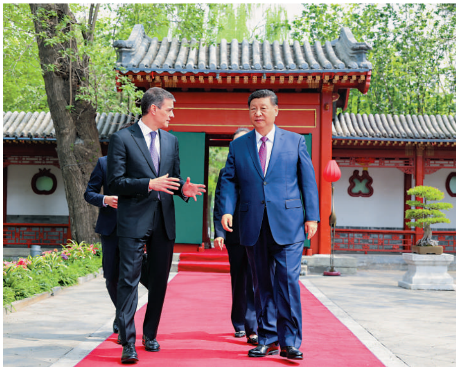
◀4月11日上午，國家主席習近平在北京釣魚台國賓館會見來華訪問的西班牙首相桑切斯。

外交部昨日宣布，中共中央總書記、國家主席習近平將於4月14日至15日對越南進行國事訪問，並將於4月15日至18日對馬來西亞、柬埔寨進行國事訪問。外交部發言人林劍在例會上介紹，此次訪問是習近平主席今年首次出訪，將為地區乃至世界的和平發展注入新動能。