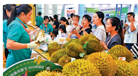
▲廣西南寧市民在中國—東盟博覽會上挑選馬來西亞榴槤。

林劍表示，此次適逢中越建交75周年，對兩國關係具有承前啟後、繼往開來的重大意義。訪問期間，習近平總書記將同蘇林總書記舉行會談，會見越南國家主席梁強、總理范明政、國會主席陳青敏。中方期待同越方一道，以此訪為契機，鞏固中越傳統友誼。