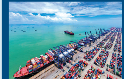
▲香港會同更多的大灣區港口商討合作，爭取貨量。

美國濫施關稅對全球經濟造成衝擊，香港特區政府部署推出一系列措施，多管齊下積極應對。行政長官李家超計劃在下月出訪中東，謀求拓展新興市場，幫助本地中小企在困難時期「走出去」。