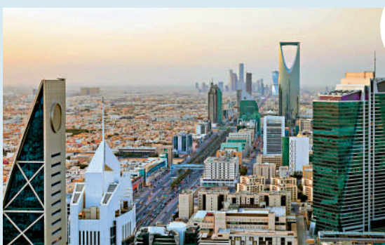
▲中東國家近年成為廣受全球注目的新興市場，極具發展潛力。