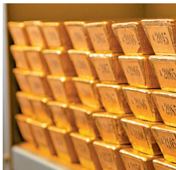
▲隨著美國國債失去避險作用，全球資金加速泊入黃金資產。

美元信心危機受到動搖，由於美國經濟例外論已站不住腳，加上美國債務負擔急增，愈來愈多人懷疑美元作為全球儲備貨幣的地位