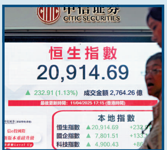
▲受內地投資氣氛熾熱帶動，恒指昨升232點，收報20914點。

持新興亞洲市場「增持」評級，看好具備強勁內部成長動力，以及有能力出台刺激政策的市場；建議輕度增持中國、印度和新加坡市場股票。她看好具備結構性成長主題的中國創新技術冠軍股（Champions），這些企業致力在互聯網、電子商務、軟體、智能手機、半導體、自動駕駛和機器人等領域，推動人工智慧技術應用。此外，她亦看好消費、金融和工業領域的龍頭股，以及高息優質國企股。