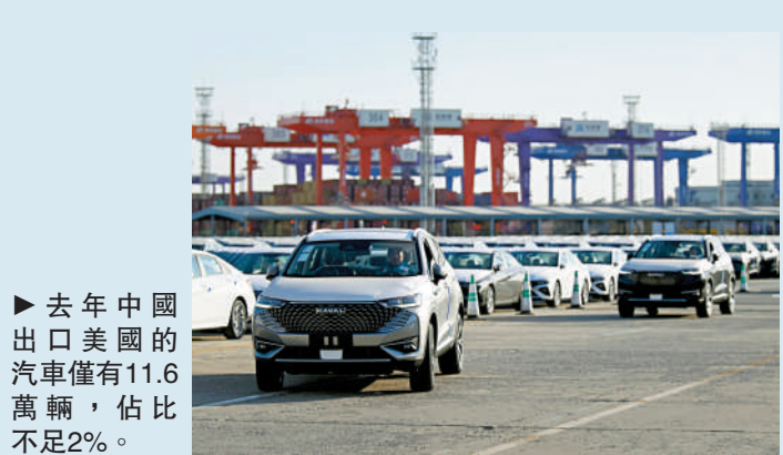
▶去年中國出口美國的汽车僅有11.6萬輛，佔比不足2%。

一季度銷量理想，加上比亞迪（01211）、吉利（00175）均發首季盈喜，帶動車股普遍向好。當中，比亞迪股價升幅達7.38%，首季交付量大升3倍多的小鵬（09868）股價則升6.67%，吉利亦有6.43%的進賬。