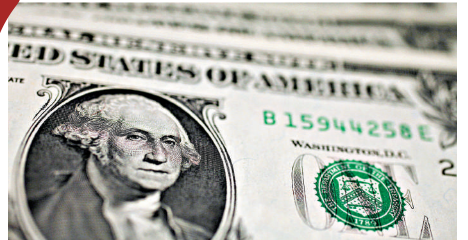
▲由於全球正拋售美元，美匯指數昨日失守100關，跌至近3年以來最低。