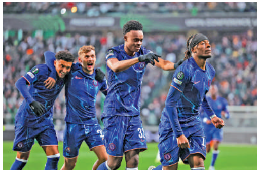
▲車路士的馬度基(右)入球後慶祝。