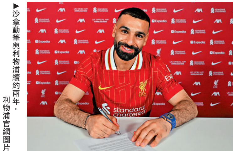
沙拿續約與利物浦續約兩年。