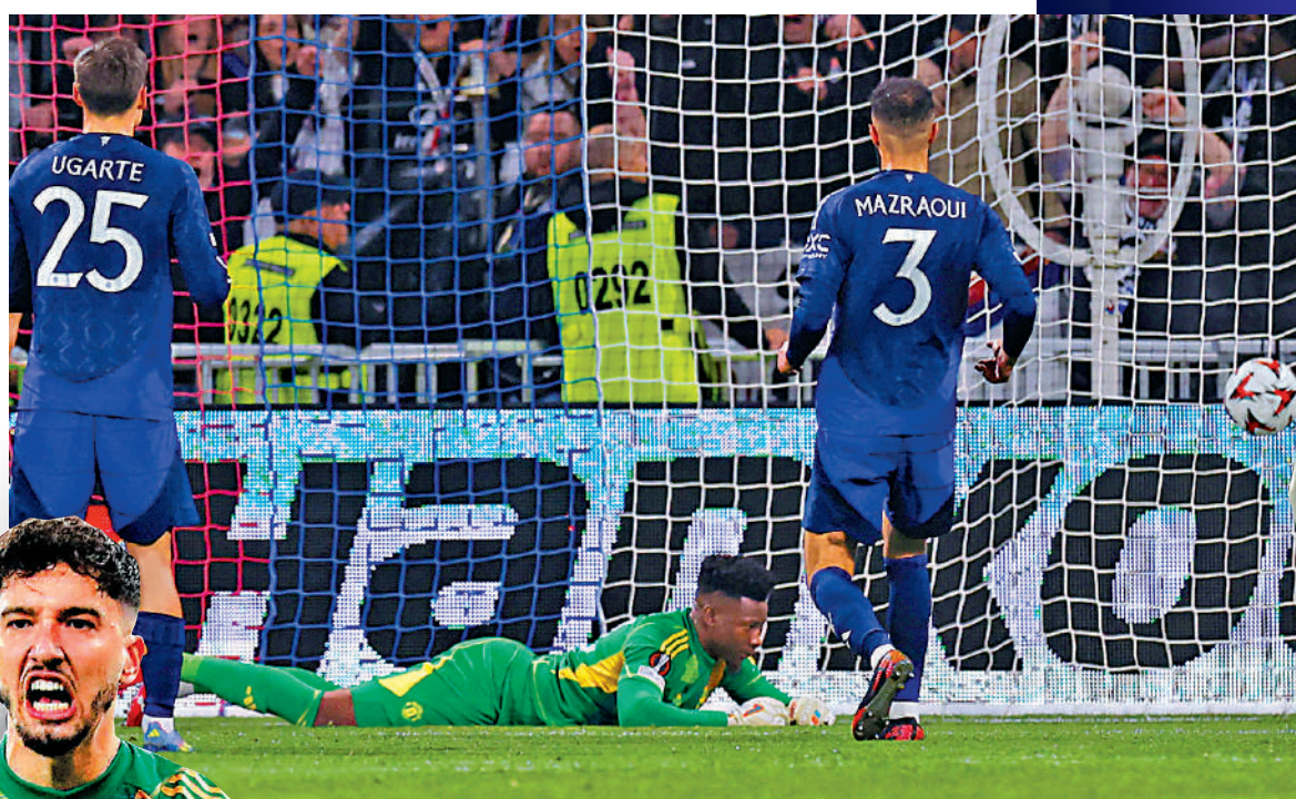
▲奧拿拿(倒地者)時有犯錯,連累曼聯失球。