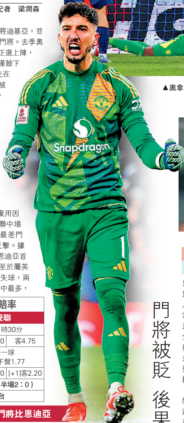
大公報記者 梁潤森

英超熱話 歐霸盃8強首回合日前結束,僅餘下此盃可爭的褪色勁旅曼聯,由於喀麥隆國門奧拿拿在比賽中接連犯錯,曼聯作客僅賽和里昂2:2。雖然主帥阿莫林賽後開腔維護對方,並表示不會改變他不輪換的戰術,但由於奧拿拿與曼聯名宿尼曼查馬迪爆發罵戰,惹怒阿莫林,因此在周日作客紐卡素的英超賽事中,將遭到棄用,預計土耳其國門比恩迪亞將獲正選上陣。除此以外,曼聯有意重聘迪基亞回巢把關,看來奧拿拿在曼聯的日子不太好過。