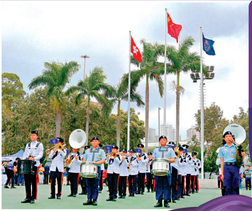
▲為響應全民國家安全教育日，民安隊總部昨日舉行開放日。圖為民安隊精神抖擻演奏中式軍樂。

【大公報訊】4月15日是第十個「全民國家安全教育日」，香港社會各界近日舉辦形式多樣的國安教育活動。律政司司長林定國昨日出席活動時表示，國家安全教育與愛國主義教育是形影不離的「孖生兄弟」。他批評國際上有國家唯我獨尊，不惜以霸道欺凌手段損害其他國家人民利益，呼籲要以不屈不撓的精神維護國家安全和合法權益。