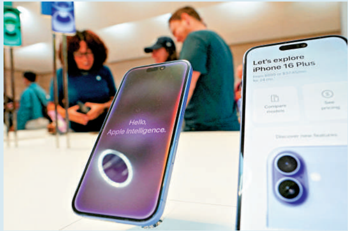
▲美國政府暫豁免向智能手機等電子產品徵收「對等關稅」。圖為紐約蘋果店內的iPhone手機。

美國海關及邊境保護局(CBP) 11日發布最新指南,稱智能手機、電腦及芯片等電子產品將得到豁免,不受特朗普政府「對等關稅」政策的影響。美國海關當天稍早向貨運業者發布警告,稱港口的報關系統出現故障,導致本周海運途中的貨物無法順利適用豁免「對等關稅」的代碼,系統故障持續超過10個小時才被修復。美媒稱,此事對已經被特朗普政府朝令夕改的關稅政策攪得暈頭轉向的美國進口商來說,又是一次打擊。