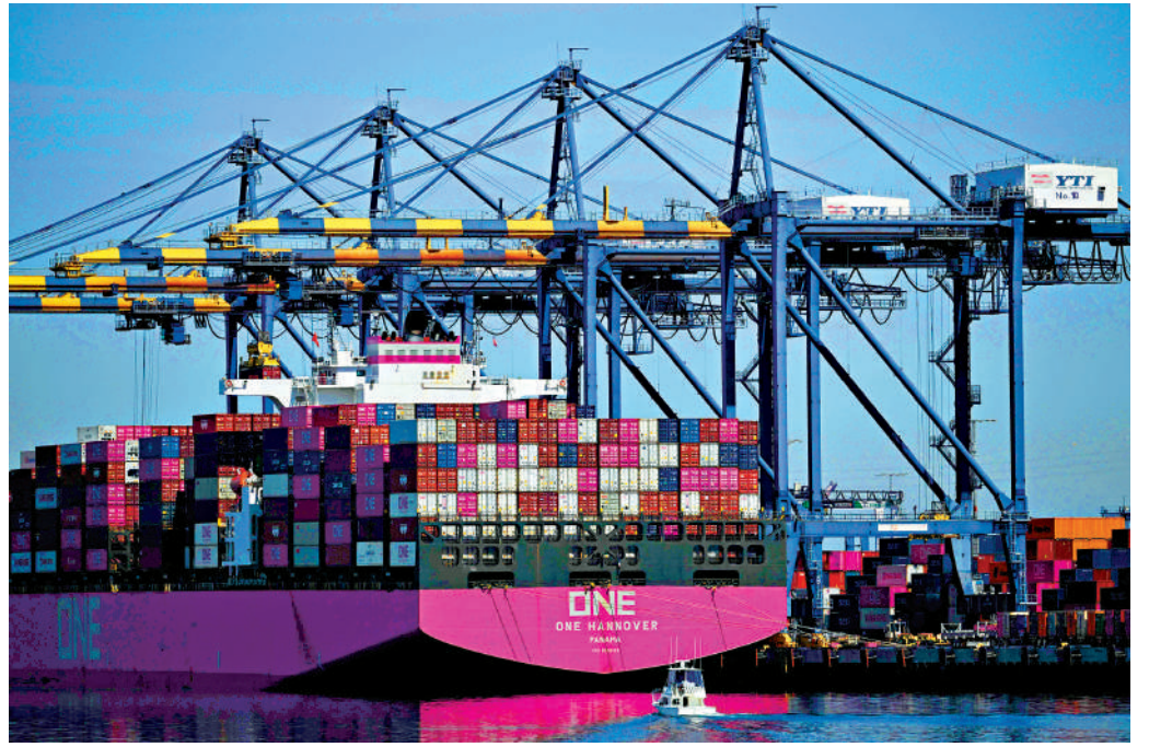
▲貨櫃船抵達加州洛杉磯港口。