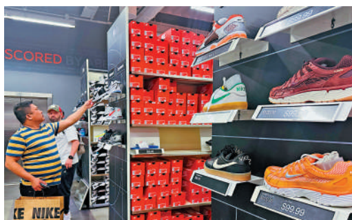
▲顧客在洛杉磯一間Nike專賣店選購鞋子。

個人護理產品品牌Dame對部分在中國製造的產品加收5美元的「特朗普關稅附加費」。公司CEO費恩表示,儘管這5美元無法完全平衡增加的成本,但必須向消費者表