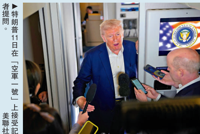
▶特朗普11日在「空軍一號」上接受記者提問。