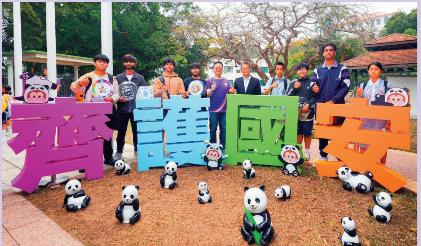
香港懲教博物館及社區教育體驗館昨日舉行開放日，介紹懲教署在維護國家安全的工作及成效。