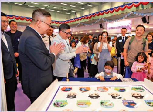
入境事務學院開放日設置攤位遊戲。