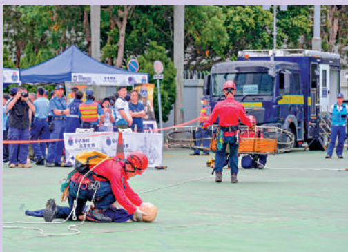
民安隊示範緊急及山嶺搜救。