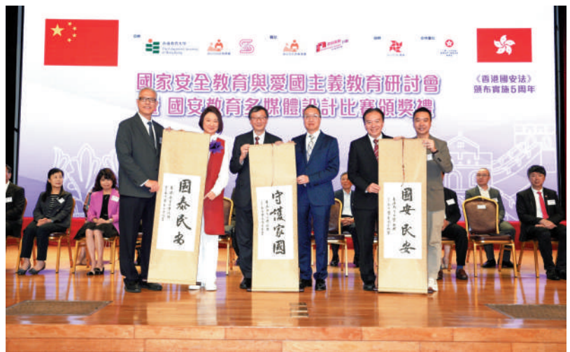
「國家安全教育與愛國主義教育」研討會暨國安教育多媒體設計比賽頒獎禮昨日舉行，一眾嘉賓在台上合照。

「培養愛國情懷，應先通過宣揚中華文化等建立和增強國民身份認同。」林定國指出，總體國家安全觀是汲取了中華優秀文化的精髓，主張安全應該是普遍、平等、包容的，不能單方面犧牲別國安全來追求所謂絕對安全。