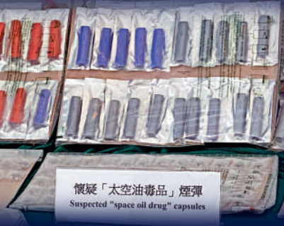
▲太空油煙彈等毒品潛伏在社區，公屋單位淪「毒品土多」。