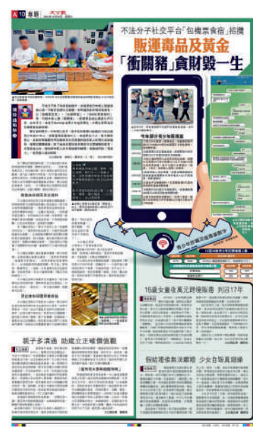
◀《大公報》去年揭發有犯罪集團利誘青少年當「衝豬」，走私黃金及毒品返港。

豪華團，作為回報「飛機豬」被要求返港前接收一些物件，以換取今次免費旅遊的成本，其間犯罪集團亦會指示骨幹成員監視，以及護送該名人士（俗稱「監豬」），以監視毒品運送情況，案中被捕內地男子負責帶貨，本地男子則為「監豬」，其中內地男子有多次來港紀錄。警方形容該販毒集團分工清晰，有人負責招募，有人負責安排其他人到海外接收毒品，「飛機豬」在「監豬」同行下會將毒品偷運返港，事成後成員會因應不同角色而獲得數萬元報酬等。