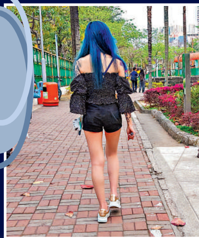
◀▼天水圍有少女拿着電子煙邊走邊吸，旁若無人，狀甚興奮。