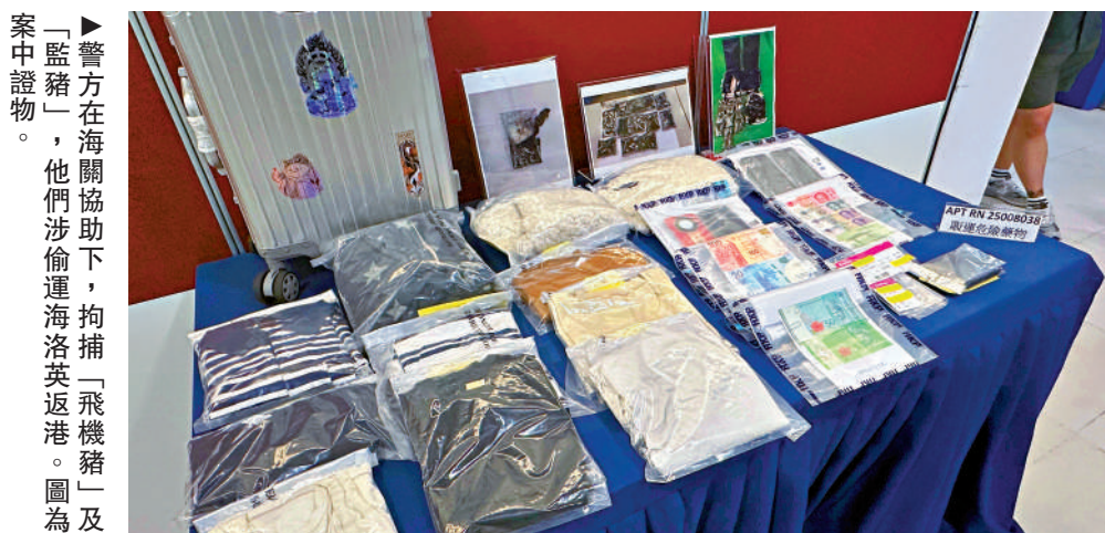
▲警方在海關協助下，拘捕「飛機豬」及「監豬」，他們涉偷運海洛英返港。圖為案中證物。

【大公報訊】記者古偉勳報導：《大公報》去年跟進「搵快錢」陷阱問題，發現有犯罪集團在網上以金錢及免費旅行利誘青少年走私黃金及毒品返港。警方近期偵破以俗稱「飛機豬」形式的販毒案，前日中午在機場鎖定兩名從馬來西亞吉隆坡返港的男子，並檢獲約4.5公斤懷疑海洛英，市值約320萬港元。