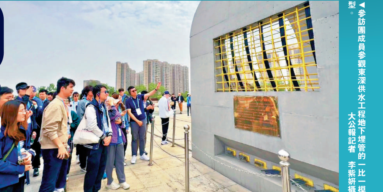
▲參訪團成員參觀東深供水工程地下埋管的一比一模型。

今年東江水供港60周年，特區政府以「一脈相連 飲水思源」為主題，舉辦一連串活動紀念及慶祝這個重要的里程碑。發展局局長甯漢豪和水務署署長黃恩諾透過局長網誌及拍片，分享國家為保障香港優質供水所作的大量工作，以及相關紀念和慶祝活動。甯漢豪表示，香港的雨水收集不足以應付全港淡水使用需求，因此主要依賴東江水供港。東江水自1965年開始輸往香港，保障了社會有足夠和穩定的供水，讓市民安居樂業，體現了國家對香港的長期關愛。坊間有建議香港自行開拓淡水資源以取代東江水供港，黃恩諾解釋，興建將軍澳海水淡化廠的主要目的在於應對氣候變化所帶來的影響，以增加供水資源多樣性，屬未雨綢繆措施，而非取代東江水作為主要水源。事實上，海水淡化生產成本比輸入東江水高出兩、三成，作為主要水源並不合乎成本效益。加上海水淡化過程較耗能，與世界減排的大趨勢亦背道而馳。