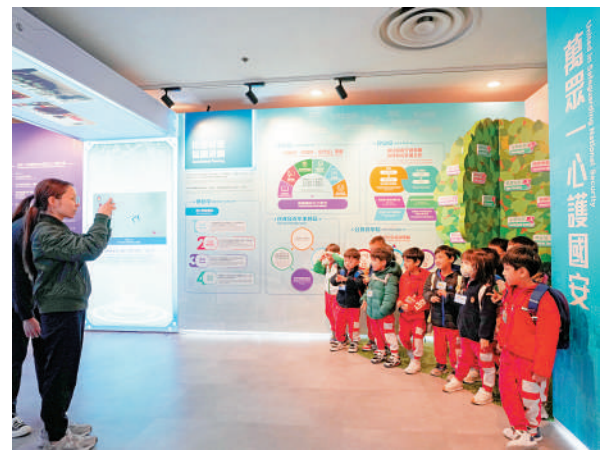
▲教育局積極邀請辦學團體和學校組織學生參觀國家安全展覽。

位於香港歷史博物館內的香港特區國家安全展覽廳自去年8月正式開放以來，香港特區政府教育局積極邀請辦學團體和學校組織學生參觀。截至本學年上學期，已有約120所中小學，超過4.3萬名同學參觀，通過展板、三維影院、互動遊戲、動畫等，加深對國家安全的認識。