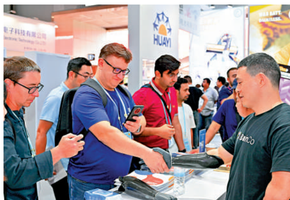
▲2024年第136屆廣交會出口意向成交額249.5億美元。圖為當屆廣交會一展位工作人員佩戴智能仿生手（右一）與境外採購商握手。

正是因為廣交會對貿易原則的嚴格遵守和堅決執行，優質國貨開始打進國際市場，重信譽、講和平、講友好的大國形象逐漸樹立，我國外貿新局面由此打開。 68年時光流逝，2025年4月的廣州，第137屆廣交會開幕在即。白雲機場入境大廳設置了「廣交會專用通道」，迎接八方來客；100台自助打證終端啟用，提高辦證效率；小程序新增「館內尋路」、在線打車等功能；手作點心、廣府非遺、國潮巡演蓄勢待發，務求讓客商足不出館，一站式體驗「南北風味並舉，中西名吃俱陳」的廣州美食文化……一個更加綠色化、智能化、數字化的廣交會，將為海內外客商提供更加高效、便利、舒適的參會體驗，同時也向世界展示一個更加開放、「廣交天下」的中國。