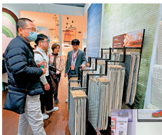
▲港人在廣州購買家居用品、家用電器等亦可申請優惠補貼。

記者了解到，這次廣州的消費品「以舊換新」活動，除了汽車外，均不需要提供舊電器的相關信息。本次補貼申領條件比較簡單，港人需要擁有港澳台通行證或居住證，以及一個中國內地手機號碼即可。