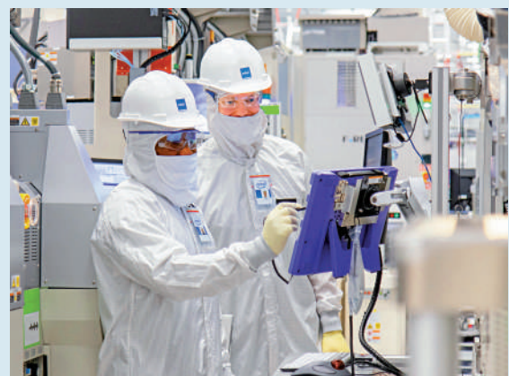
▲美國芯片商或被轉承擔關稅成本。圖為英特爾的工程師在愛爾蘭工廠工作。