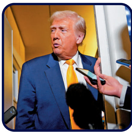
▲特朗普關稅政策反覆無常，引發混亂。

4月2日 ● 特朗普宣布將對幾乎所有進口商品加徵10%的「基準關稅」，並對中國、歐盟等貿易夥伴徵收更高的「對等關稅」。