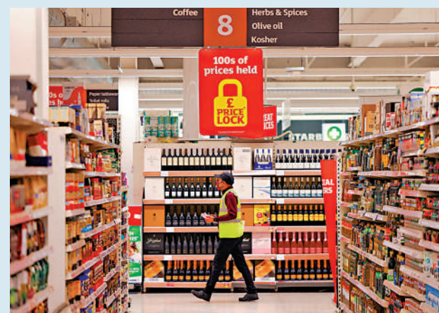
▲英國政府宣布暫停對89種產品徵收關稅，以減輕企業和消費者負擔。

日本代表團將於17日赴美進行貿易談判，預計將涵蓋關稅、非關稅壁壘和匯率等議題。日本首相石破茂14日稱，日方不打算作出重大讓步，也不會急於在關稅問題上與美國達成協議。