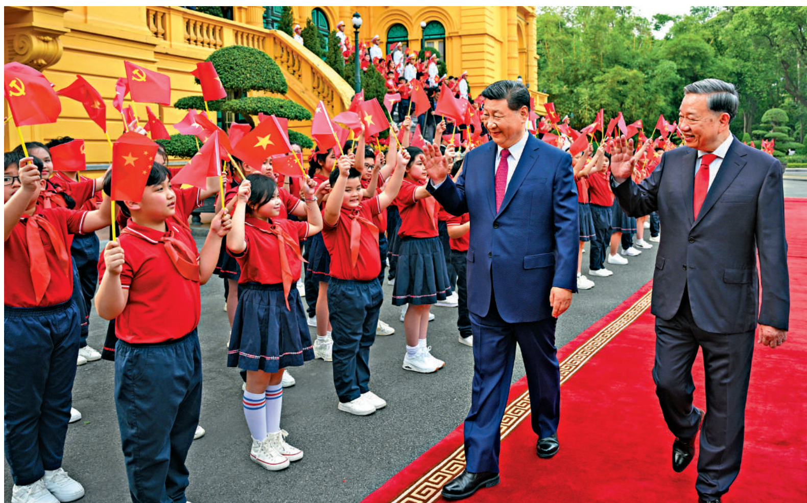
▲4月14日，中共中央總書記、國家主席習近平抵達河內對越南進行國事訪問。當日下午，習近平和越共中央總書記蘇林一同步行前往越共中央駐地舉行會談時，向歡迎人群揮手致意。

當日下午，習近平在越共中央駐地同蘇林舉行會談。習近平指出，構建中越命運共同體具有重要世界意義。小船孤篷經不起驚濤駭浪，同舟共濟方能行穩致遠。中國和越南都是經濟全球化的受益者，要增強戰略定力，共同反對單邊霸凌行徑，維護全球自由貿易體制和產業鏈供應鏈穩定。