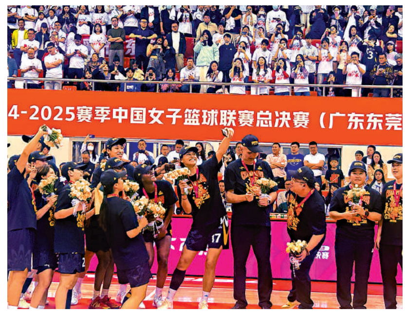
▲廣東女籃球員慶祝奪冠。