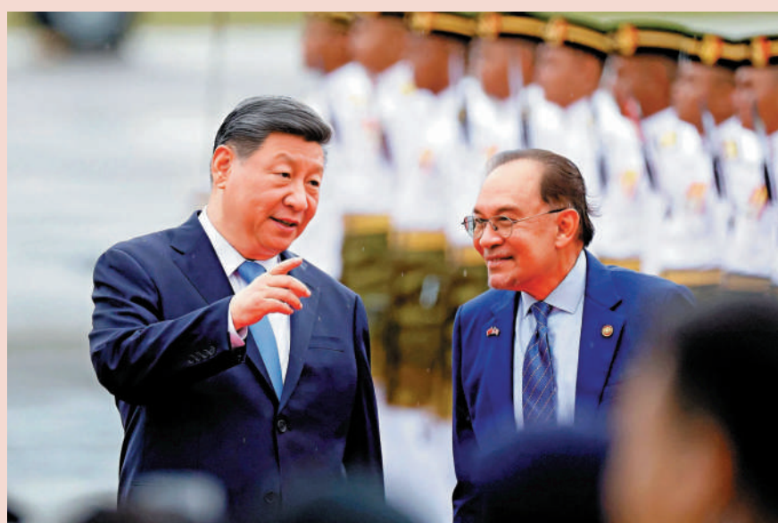
▲當地時間4月15日晚，國家主席習近平乘專機抵達吉隆坡，開始對馬來西亞進行國事訪問。專機抵達吉隆坡國際機場時，馬來西亞總理安瓦爾等熱情迎接。

當地時間4月15日晚，國家主席習近平乘專機抵達吉隆坡，應馬來西亞最高元首易卜拉欣邀請，對馬來西亞進行國事訪問。習近平發表書面講話。