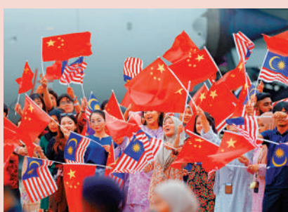
▲當地時間4月15日晚，國家主席習近平乘專機抵達吉隆坡，開始對馬來西亞進行國事訪問。這是歡迎人群。

習近平指出，中國和東盟各國的友好合作穿越時代風雨、歷久彌堅。中國堅定支持東盟團結和東盟共同體建設，支持東盟在區域架構中的中心地位，全力支持馬來西亞履職2025年東盟輪值主席國，期待馬來西亞作為中國東盟關係協調國更好發揮橋樑作用。中國正在以中國式現代化全面推進強國建設、民族復興偉業，願同馬來西亞和其他東盟國家一道，順應和平與發展歷史潮流，抵禦地緣政治和陣營對抗暗流，衝破單邊主義、保護主義逆流，推動高水平戰略性中馬命運共同體破浪前行，攜手打造更為緊密的中國—東盟命運共同體。