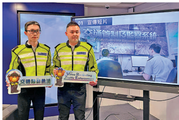
▲警方將於4月22日起，在港島區試行「交通管制及監察系統」。