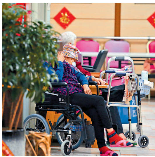
▲本港人口老化持續，銀髮服務逐漸盛行。

消委會接獲的其中一個個案投訴人為正在醫院留醫的丈夫，在安老院支付訂金2000元預訂宿位，以便出院後即時入住。惟其丈夫在兩個月後不幸離世未能入住，投訴人認為此屬不可預見的情況，而非自願放棄入住，故希望院舍退還訂金，但院舍以收據列明「倘不入本院舍，所繳訂金不獲退還」為由拒絕退款，投訴人遂向消委會求助。