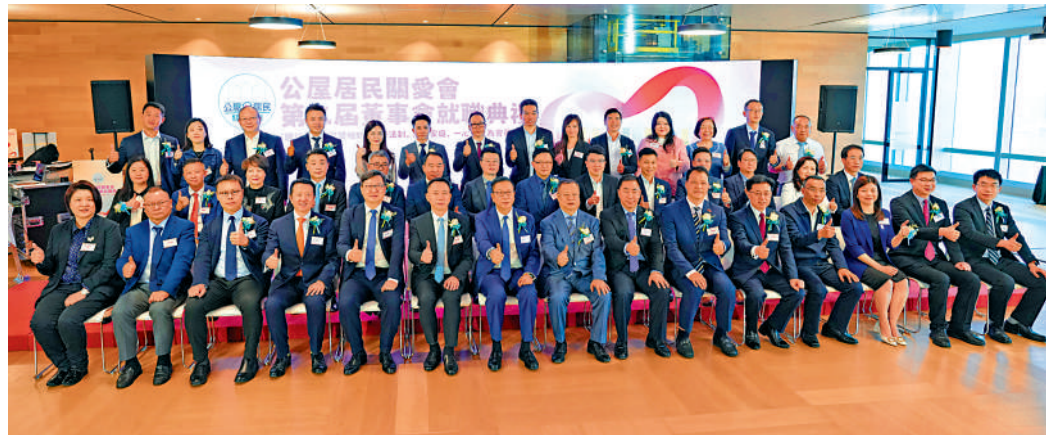
▲公屋居民關愛會第二屆董事會就職典禮昨日舉行。