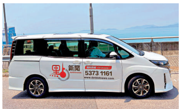
▲採訪車啟用後，點新聞將更快奔赴現場，更好報導新聞。

爆料熱線 (WhatsApp) : 5373 1161 聯絡電郵: contact@dotdotnews.com