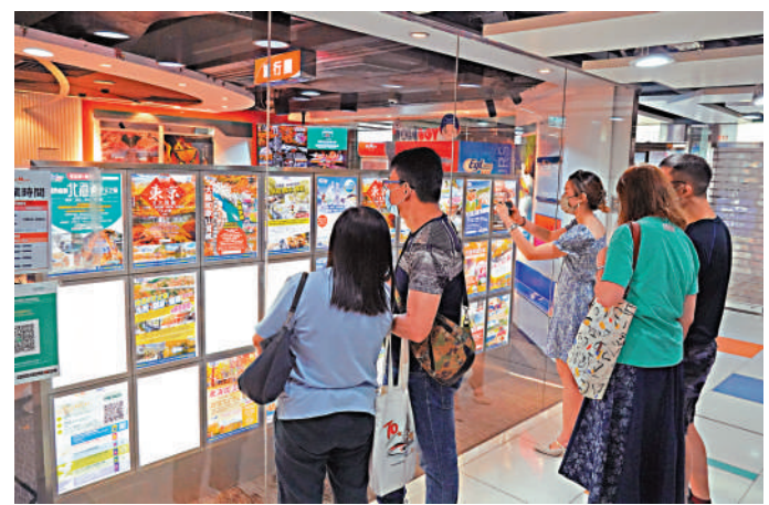
▲復活節假期將至，不少市民都選擇出外旅遊。

【大公報訊】記者鄭文迪報道：消委會調查市面27個單次個人旅遊保險計劃，發現即使保費相若的計劃，但「醫療費用」最高賠償額可相差一倍；逾九成計劃會調低長者及兒童的最高賠償額，最多調低達75%，甚至不能享用部分保障。