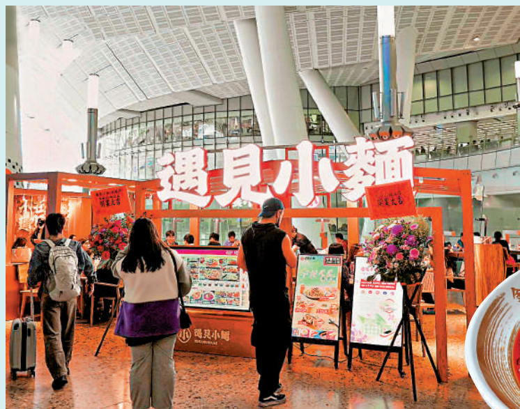
▲遇見小麵為內地最大的川渝風味麵館經營者，在香港有6間分店。