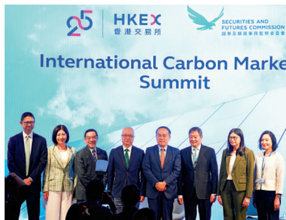
▲國際碳市場峰會匯聚各地監管機構、碳交易平台、企業和投資界的代表，探討發展全球碳市場的機遇與挑戰。

許正宇強調，要推動香港綠色創新科技發展，除依賴私人市場，有時亦需要政府參與，故此特區政府正積極推動公私營創新合作，透過資助計劃推動相關概念認證項目發展，目前已經有12個項目，包括協助企業在不同市場更好管理碳信用交易等，另香港現時每年綠色及可持續相關