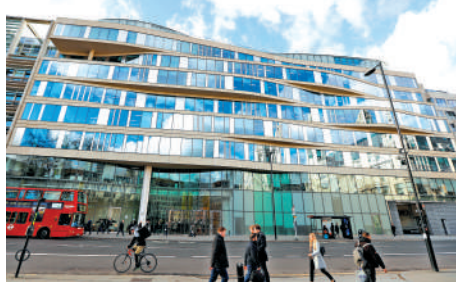
▲LME（倫敦金屬交易所）已核准首批位於香港的倉儲設施。