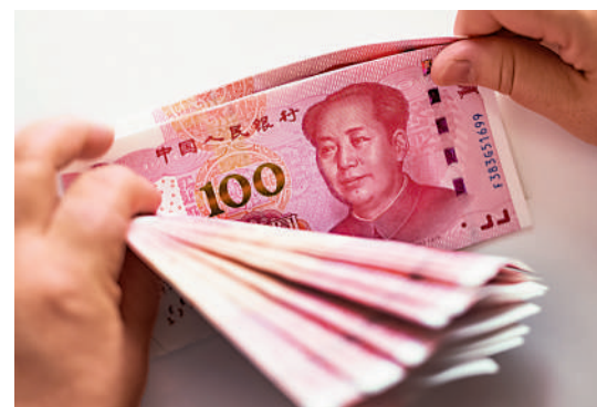
▲中國財政部將於下周三在港發行新一批人民幣國債。

據渣打統計，受中國人民銀行貨幣政策放鬆、人民幣國際化提速以及離岸市場需求走強推動，2024年離岸人民幣債券市場規模再創歷史新高。預計2025年離岸人民幣國債發行規模將保持強勁，至少與2024年基本相當。