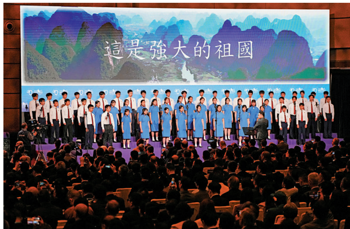
▲聖保羅男女中學演唱了《我的祖國》和《我們的家》的合併版本。

聖保羅男女中學以其悠久的歷史和卓越的表演屢獲殊榮。去年七月，該校合唱團更在新西蘭奧克蘭舉行的第十三屆世界合唱比賽中，勇奪「中學合唱組」冠軍及「當代音樂混聲組別」亞軍等獎項，為港爭光。獲獎消息宣布後，合唱團的數十名香港學生手持五星紅旗與香港特區區旗，從台下奔上舞台，滿懷激情地高唱《義勇軍進行曲》，場面振奮人心，充分展現了年輕一代的愛國情懷與活力。