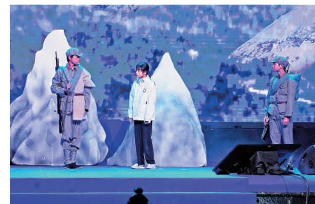
▲舞台情景短劇的小演員演活了國家情懷。