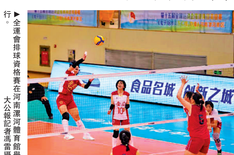
全運會排球資格賽在河南漯河體育館舉行。

【大公報訊】記者馮雷河南報道：15日，第15屆全國運動會排球項目資格賽（女子18歲以下C組、D組）在河南漯河體育館開幕，4場精彩對決相繼上演。河南隊以局數3：0完勝雲南隊，安徽隊以3：1擊敗山西隊，山東隊以3：0完勝新疆隊，浙江隊以3：1戰勝福建隊。 比賽期間，來自河南、山東、新疆、雲南、北京、浙江、安徽、山西、福建的9支隊伍共155名運動員，於4月15日至19日展開激烈角逐，爭奪晉級。4月22日至24日還將舉行A、B、C、D組第3名隊伍之間的附加賽。 漯河作為本次賽事的承辦地，在排球賽事舉辦方面經驗豐富。此前，漯河已承辦中國國際女排精英賽、世界女排大獎賽、世界男排聯賽、全國排球聯賽河南主场比賽等一系列高水平排球賽事，擁有完善的體育設施和豐富的賽事組織經驗。