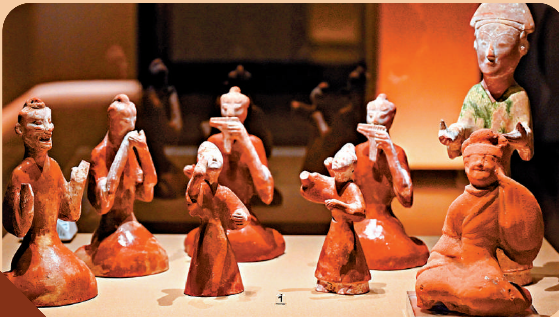
▲相和歌俑（左，漢，前202—220年）和陶撫耳俑（右，東漢，25—220年）呈現了相和歌的演出場景。

值得一提的是，為了讓觀眾更好地感受音樂文化的獨特魅力，展覽特別還原了雲岡石窟中以大量演奏樂器的造像而得名「音樂窟」的第十二窟，借助數字光影技術，為觀眾帶來多感官的展覽體驗。