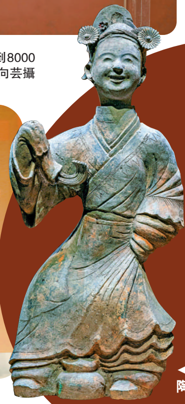
▲國家一級文物陶立舞俑。

展訊 錦城絲管：和合共鳴的音樂成都 日期：即日起至5月5日 地點：成都博物館一層特展廳 費用：免費（需預約入館）