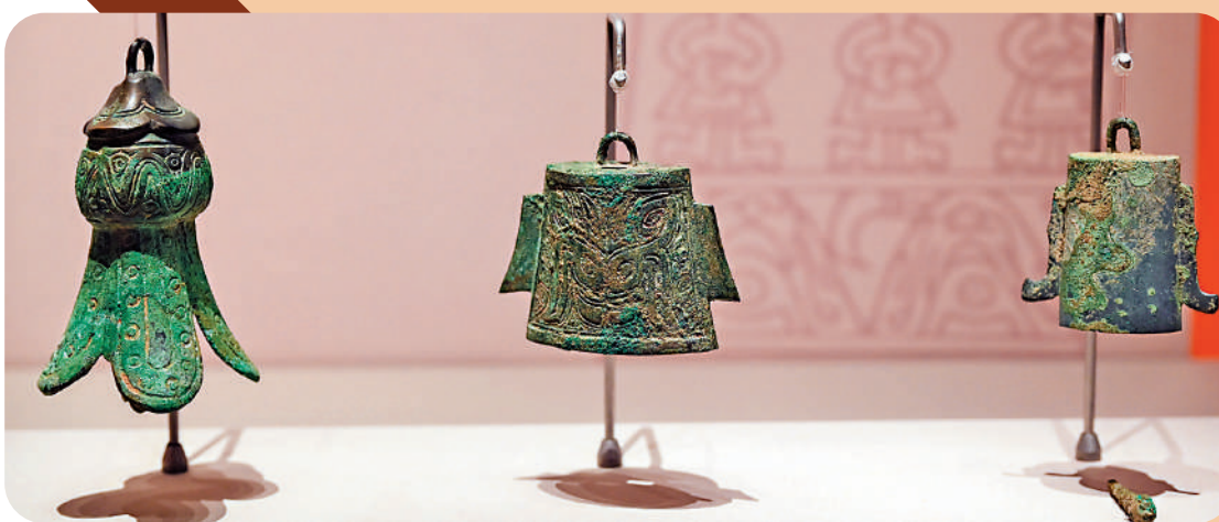
▲三星堆遺址出土的花蒂形青銅鈴、獸面紋青銅鈴等。