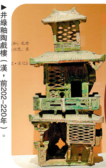
▲井綠釉陶戲樓（漢，前202—220年）。