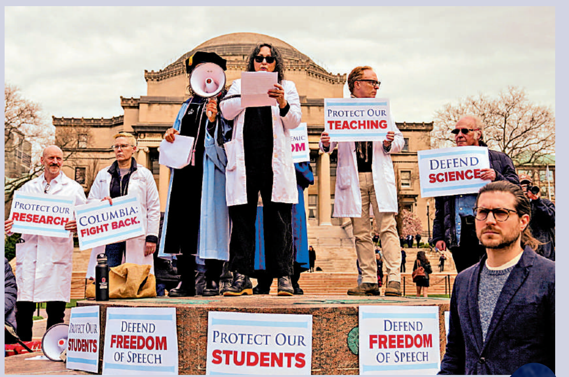
▲美國哥倫比亞大學研究人員和教職工抗議特朗普政府。