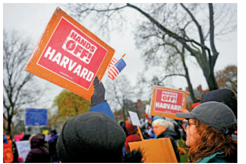
▲示威者抗議特朗普政府打壓學術界。

今年3月，加拿大一名試圖繼續工作簽證的女演員在美國—墨西哥邊境入境時被美國海關拘留11天。同月一名法國科學家當月抵達美國得州時也被搜查手機。由於他曾批評特朗普削減科研經費，被美國當局視為「仇恨與陰謀論言論」，遭聯邦調查局（FBI）調查。這名科學家最後被拒絕入境。當月，德國外交部發布了旅行建議，強調美國簽證或免簽證入境許可，都無法確保順利入境。英國外交部也更新旅行建議，警告違反美國入境規定的英國人可能面臨嚴重後果。丹麥、芬蘭也更新了有關本國跨性別者赴美旅行的提醒，若申請人護照上記錄的當前性別與出生時指定的性別不同，美國當局可能會拒絕入境。