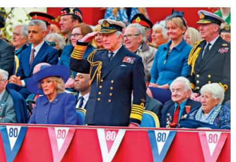
▲英國國王查爾斯三世在參加慶祝二戰勝利80周年活動。

除了英國，荷蘭5日在瓦赫寧根舉行解放日活動，波蘭總理圖斯克受邀發表演說，呼籲歐洲「必須深化跨大西洋團結」。荷蘭全境於晚間進行兩分鐘默哀。荷蘭國防部長布雷斯爾曼呼籲努力培育和平。他表示：「戰爭和侵略又回到了歐洲，我們有責任保護和平。」