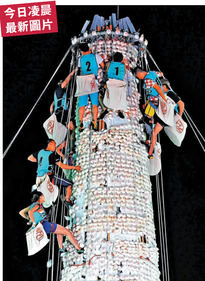
今日凌晨 最新圖片 遊客睇搶包山盡興