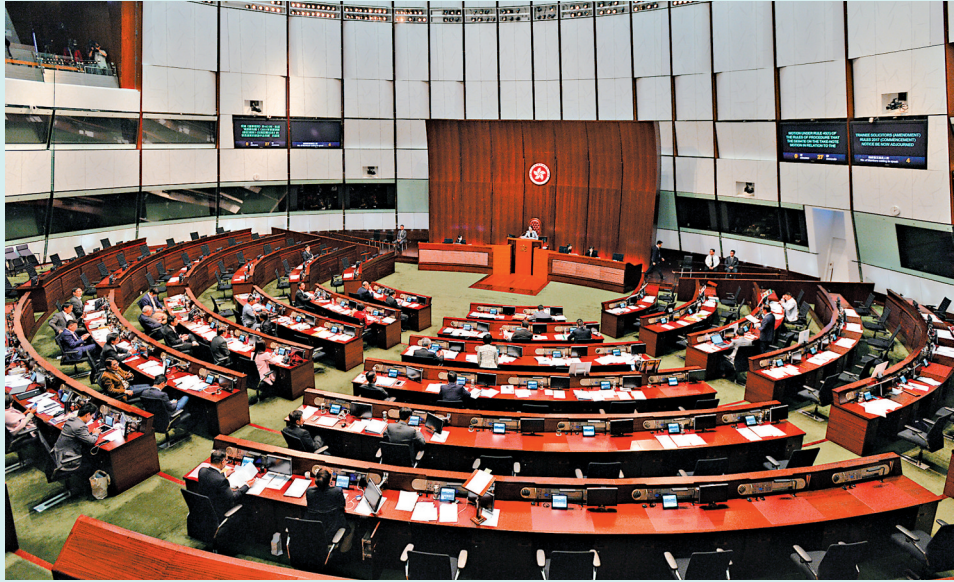
▲立法會主席梁君彥表示，正爭取7月內完成修改議事規則及通過《立法會（權力及特權）條例》（第382章）修訂。