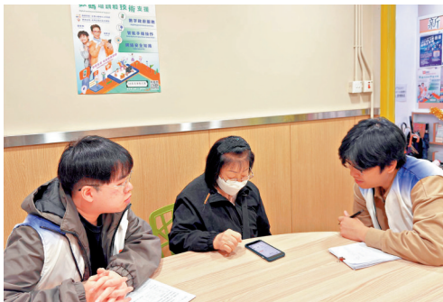
▲推行機構在社區支援點提供服務，為長者解答在使用智能手機方面的查詢。

推行機構採用深入淺出的方法，鼓勵長者學習日常生活中實用的流動應用程式和數碼服務，包括如何使用「智方便」、醫健通、HA Go和My SmartPLAY等常用的政府流動應用程式，以及學習網絡安全知識等，從而更有效、更到位地協助長者提升使用數碼科技的能力。