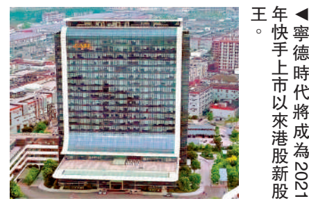
▲寧德時代將成為2021年「快手」上市以來港股新股

281.23港元)，意味着H股最終發售價或較昨日A股股價折讓6.4%。寧德時代已於本週四 (15日) 結束招股，綜合市場統計，共獲券商借出2822.98億元孖展額，較公開發售額23.25億元超額認購120.39倍，並將於下周二 (20日) 正式上市。