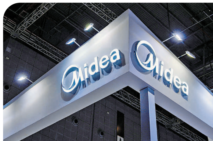
▲美的集團和中通快遞同躋身恒指成份股。