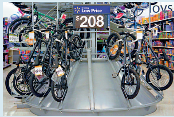
▲美國康涅狄格州一家沃爾瑪超市裏陳列的自行車，預計將面臨漲價。

美國零售巨頭沃爾瑪15日表示，由於無法免於關稅帶來的衝擊，計劃5月底開始上調部分商品在美售價。美媒指出，以平價著稱的沃爾瑪宣布將提高價格，這是迄今為止關稅對美國購物者造成影響的最明確信號。作為零售業龍頭老大的沃爾瑪也難以頂住關稅壓力，可能會引發全美零售業連鎖反應，這將進一步推動美國通貨膨脹上升，給美國家庭構成直接衝擊。