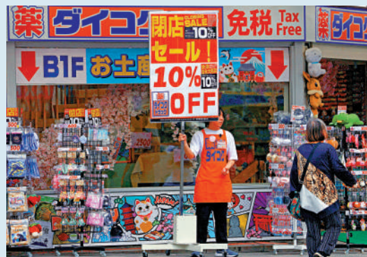
▲日本首季GDP表現不佳。圖為東京店員站在商店外試圖招攬顧客。

擎。美國目前對進口汽車，以及鋼鐵和鋁產品徵收25%的關稅，對於嚴重依賴汽車出口的日本