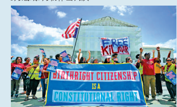
▲示威者在美國最高法院外抗議特朗普終止出生公民權。