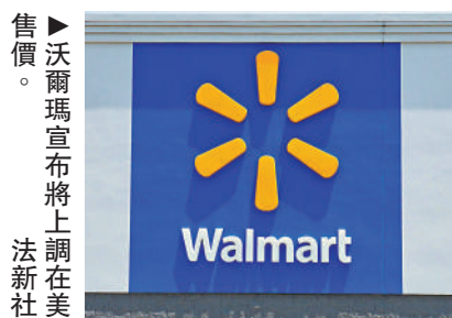
▲沃爾瑪宣布將上調在美售價。

●沃爾瑪等美國零售商：這些零售商的電子產品、玩具、食品等大規模消費品都依賴進口，隨着沃爾瑪宣布漲價，Target、Lowe和家得寶等其他零售商也將紛紛效仿漲價。