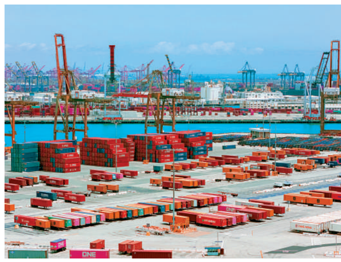
▲洛杉磯港口集裝箱數量近期大減。