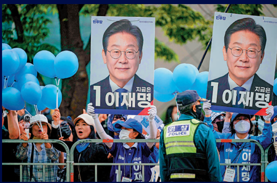
▲李在明支持者18日在首爾舉行集會。