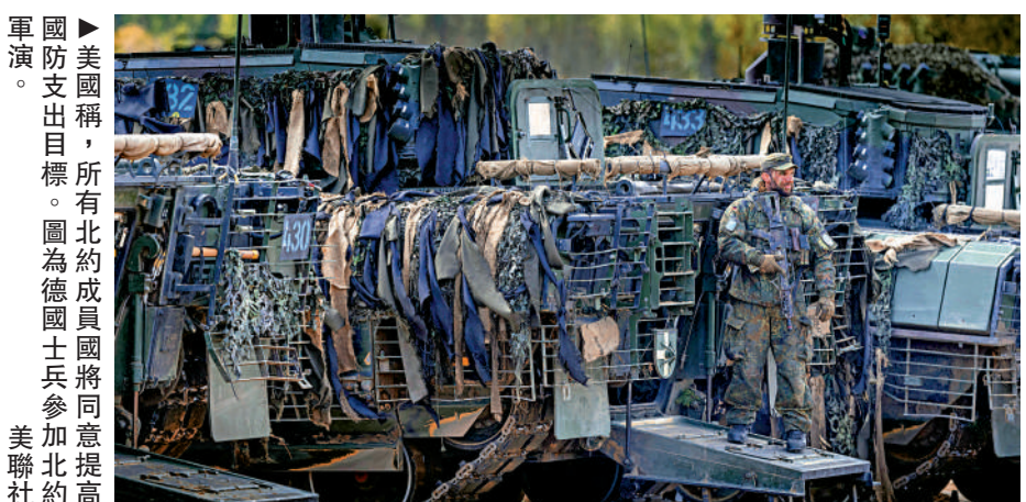
▲美國國防支出目標，所有北約成員國將同意提高至5%。圖為德國士兵參加北約高層會議。

萬斯與澤連斯基在現場面帶微笑握手。這是他們今年2月底在白宮爆發激烈爭吵以來首次會面。魯比奧17日稱，梵蒂岡可能成為俄烏會談地點。18日就職彌撒結束後，利奧十四世與澤連斯基會面。澤連斯基隨後感謝梵蒂岡願意為俄烏直接談判提供平台。