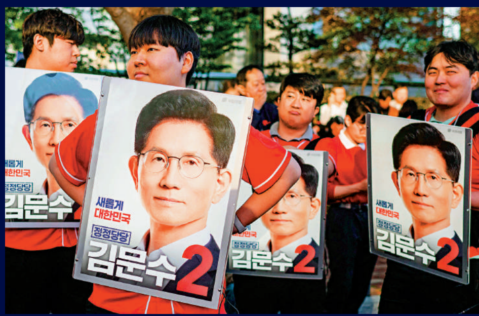
▲金文洙支持者18日在首爾舉行集會。

韓國將於6月3日舉行總統選舉，4名主要候選人5月18日參加首場電視辯論會，就選民最關注的經濟問題及如何應對美國關稅展開交鋒。最熱門人選、共同民主黨候選人李在明表示，韓國沒有必要倉促地與美國進行關稅談判。同日，李在明提出修憲構想，主張將韓國總統任期由五年且不可連任，改為四年且可連任一屆，並提出限制總統宣布緊急戒嚴的權限。