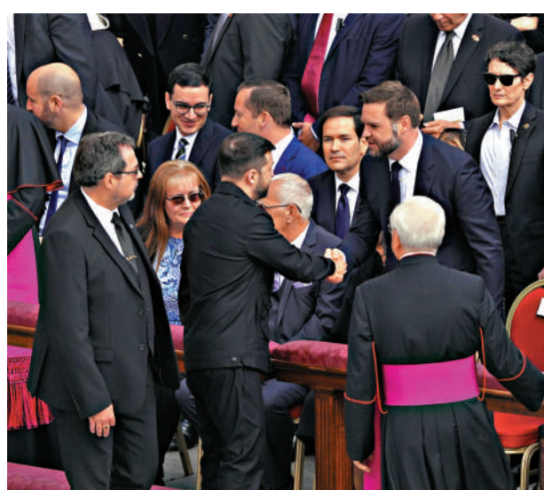
▲澤連斯基（前排左二）在梵蒂岡與萬斯握手。