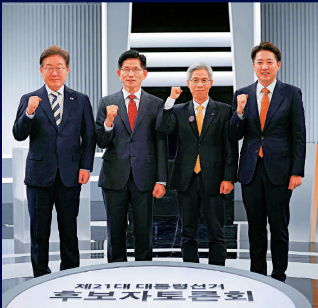
▲（從左到右）李在明、金文洙、李俊錫和權英國23日參加韓國總統候選人第二次電視辯論。美聯社 ▶韓國共同民主黨總統候選人李在明（上）和國民力量黨候選人金文洙的競選橫幅。美聯社

韓國第21屆總統選舉將於6月3日正式舉行，民調機構蓋洛普韓國23日發布最新調查結果顯示，一度以明顯優勢領跑的最大在野黨共同民主黨候選人李在明，支持率突然下滑至45%。執政黨國民力量黨候選人金文洙的支持率則上漲7個百分點至36%，與李在明差距縮小。這場原本被視為「毫無懸念」的選舉目前風向突轉，分析認為，保守派候選人能否合併成為國民力量黨「逆風翻盤」的關鍵。