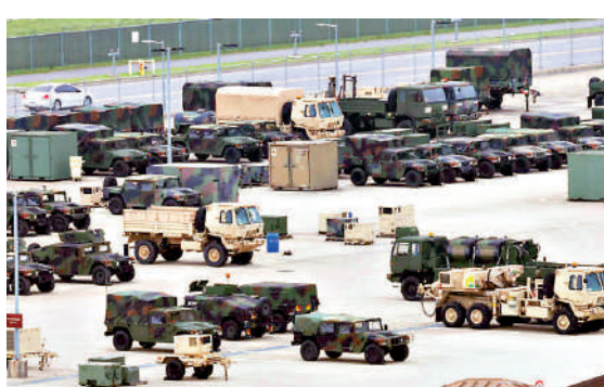
▲有報道指美國政府考慮減少駐韓美軍，圖為駐韓美軍的汽車。網絡圖片

總統任期曾考慮調整駐韓美軍規模，並要求韓方支付駐軍費用。多名美國官員說，在俄烏衝突局勢尚未明朗之前，不會作出駐軍調動的決定。 分析指出，減少駐韓美軍可能會引起韓國、日本和菲律賓等長期在軍事上依賴美國的盟友緊張不安。