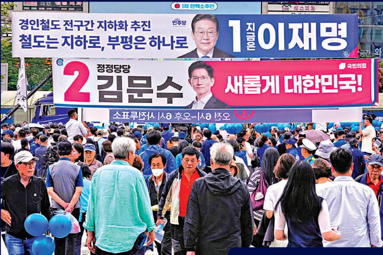
第21屆韓國總統選舉民意調查

【大公報訊】韓國總統大選進入最後倒計時，民調風向卻突然轉變。蓋洛普韓國最新調查結果顯示，原本一直以巨大優勢領先的共同民主黨總統候選人李在明，支持率下滑了6個百分點至45%。與此同時，執政黨國民力量黨候選人金文洙支持率上升7個百分點至36%，與李在明的差距由22個百分點驟減至9個百分點，選情日趨激烈。 李在明4月中旬辭去共同民主黨黨首職務，並宣布參選總統時，韓國蓋洛普民調顯示他的支持率為38%。當時，金文洙的支持率僅為7%。根據「蓋洛普韓國」的說法，國民力量黨確定總統候選人較晚，並且一度出現「換洙」風波，導致金文洙在先前民調中支持率低迷。 國民力量黨支持率爬升 國民力量黨本月初爆發「換洙」爭議，原本經過黨內初選推選為總統候選人的金文洙，10日凌晨被取消候選人資格，由韓德洙登記候選人。同為保守派