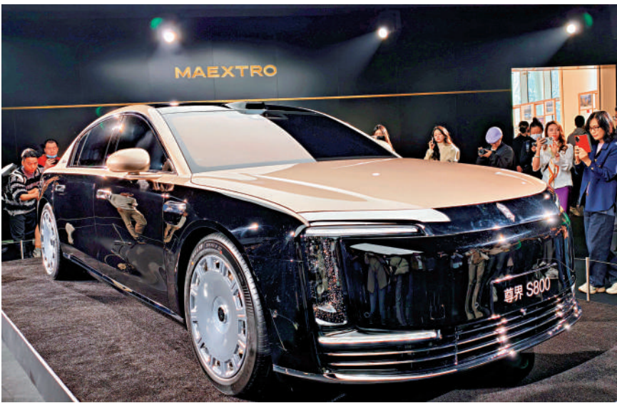
▲尊界S800搭載華為六大首發技術，共4款車型，8月中旬批量交付。