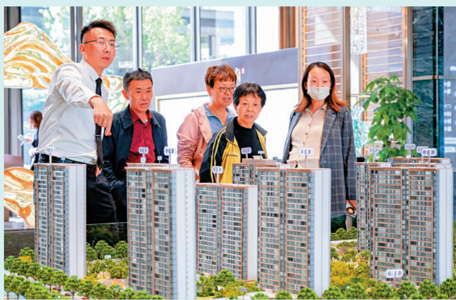
5月內地主要城市新房價格延續結構性上漲。