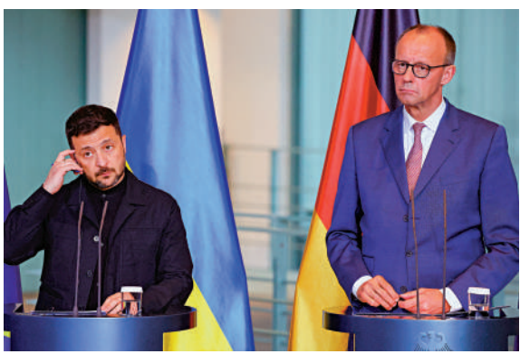
►默茨（右）5月28日在柏林與澤連斯基會面。

俄總統新聞秘書佩斯科夫批評默茨破壞解決俄烏衝突的外交努力。俄國家杜馬國防委員會第一副主席茹拉夫廖夫警告說，即便遠程武器從烏境內向俄羅斯發射，俄方也將認定武器提供國直接介入衝突，「他（默茨）考慮不周的舉動正把德國拖入與一個擁核國家的武裝衝突」。