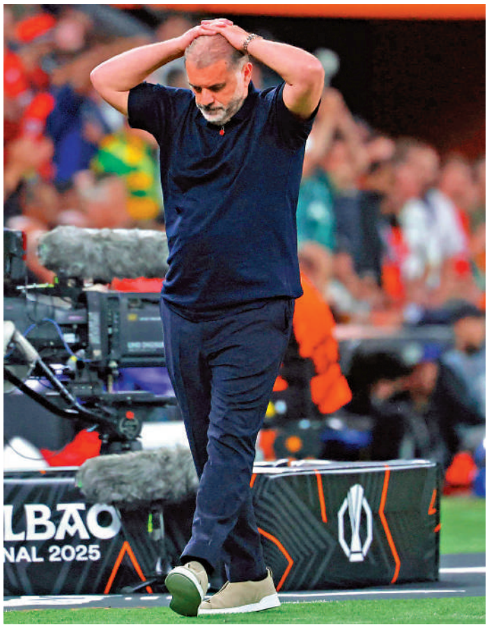
▲普斯迪高古已經被熱刺辭退。

三球不敵挪威 【大公報訊】世界盃外圍賽歐洲區周六舉行多場賽事，I組由挪威主场迎戰傳統勁旅意大利，在今屆世盃外首度亮相的意大利踢出差家一仗，在半場已被攻入3球下輸0：3，慘遭滑鐵盧的意大利更創下多個恥辱紀錄，包括隊史首次世盃外上半場失3球，連同上屆賽事在內，首次遭遇世盃外兩連敗，以及連續3場不入球，這支曾4奪世盃冠軍的勁旅，隨時連續3屆無緣世界盃決賽周。