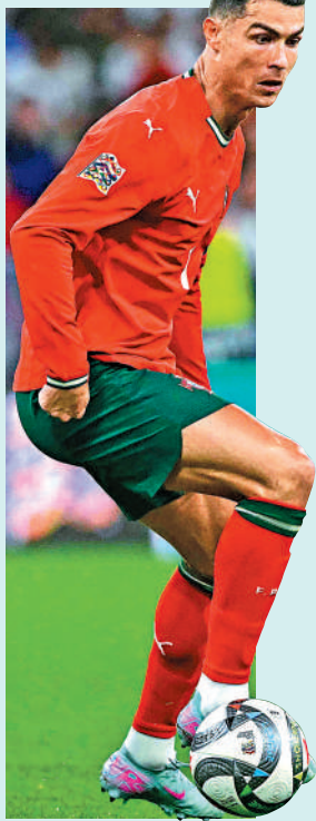
▲葡萄牙前鋒C朗拿度。

【大公報訊】歐洲國家聯賽在德國舉行決賽，由葡萄牙與西班牙爭奪冠軍。葡萄牙於4強反勝德國，入球莫勝的C朗拿度盡顯實力及鬥心，明顯希望再次捧盃；西班牙亦於4強以5：4擊敗法國，新星耶馬爾個人射入兩球亦盡見功架，雙方狀態同處巔峰下，今仗下注買入球大細的「大」看入球騷更佳。（UEFA.tv明晨3時直播）