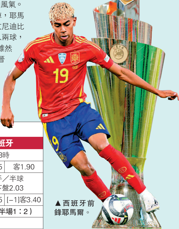
▲西班牙前鋒耶馬爾。