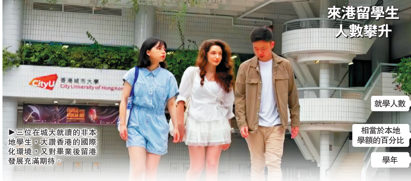
來港留學生 人數攀升

▶三位在城大就讀的非本地學生，大讚香港的國際化環境，又對畢業後留港發展充滿期待。